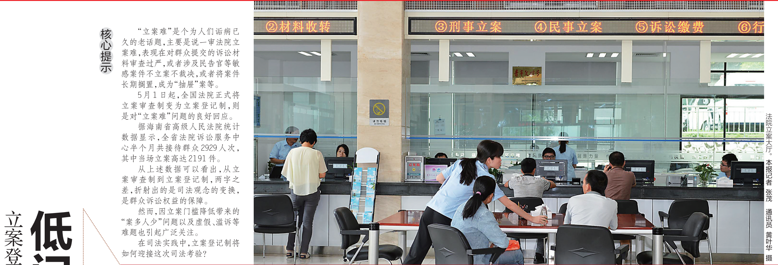
法院立案大厅。