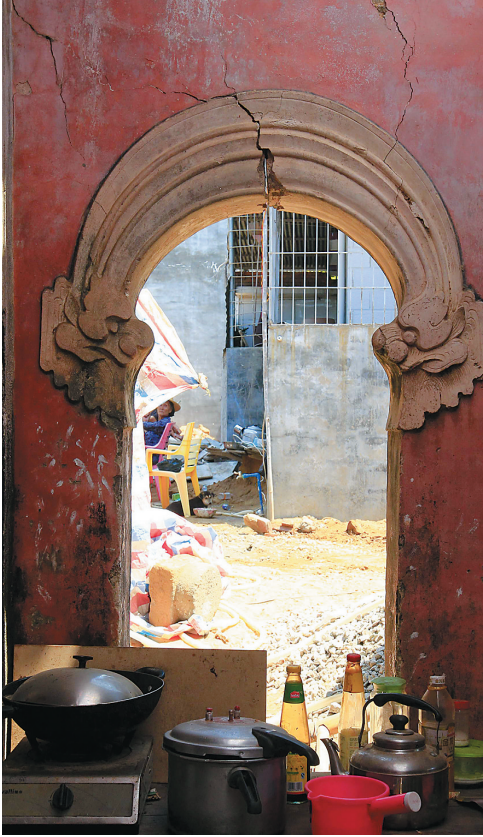
中厅开裂的墙体。