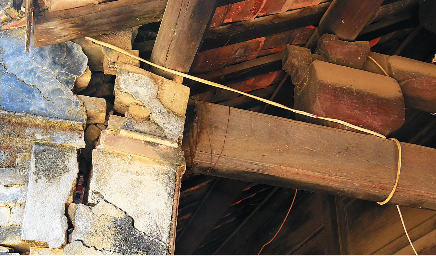
正堂支撑房梁的砖柱已经开裂。