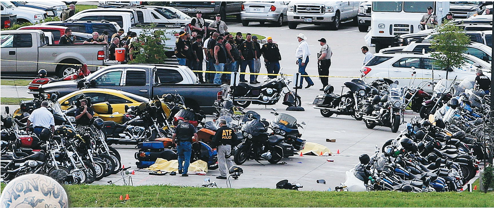
美国得克萨斯州韦科市,飞车党帮派枪战现场。

当地时间5月17日,美国得克萨斯州韦科市5个飞车党帮派在一间餐厅发生械斗,冲突随后升级到枪战,造成9人死亡,十余人受伤。警方现场拘捕192人,缴获武器逾百件。之后,各飞车党帮派又向韦科市聚集,警方全城布控,严加防范,飞车党又一次强势进入人们的视野。