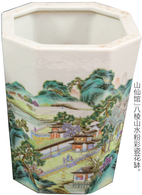
文昌市博物馆收藏的清代『海山仙馆』八棱山水粉彩瓷花鉢。

早年在广州学习时,就喜逛充满岭南风情的粤式园林,惜海山仙馆尘灭于历史滚滚红尘中,无缘得遇。然全国第一次可移动文物普查中与文昌市博物馆这对“海山仙馆”款八棱山水粉彩瓷花鉢的不期而遇,似乎是冥冥中安排的一场“初见”。