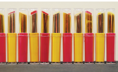
《口红》苏宇俊 地沟油系列