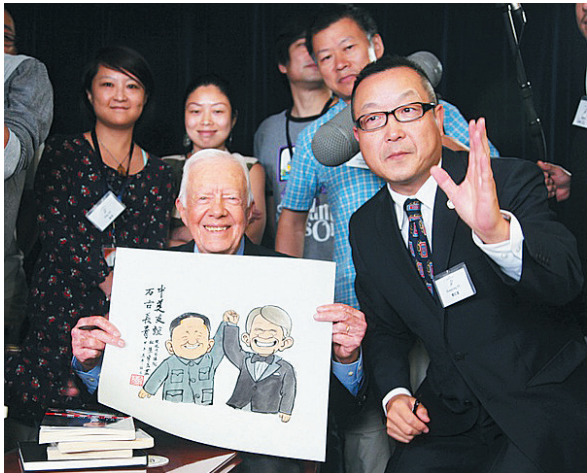
剧组拜访美国前总统卡特。

《旋风九日》上映以来,目前票房不足600万元,与《复仇者联盟2》打擂台固然勇气可嘉,但现实却是严峻而残酷的,这部以商业模式制作的纪录片,尽管面临着档期失策、宣传不利等多种因素,导致票房不佳,但是在今年的华语电影里,它属于优质的那一类,也值得被影迷所记住。 [图]