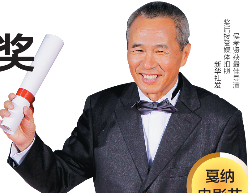
侯孝贤获最佳导演奖后接受媒体拍照