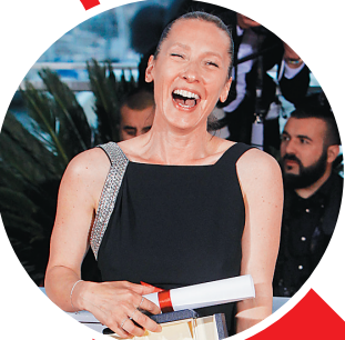
埃玛纽埃勒·贝尔科

第68届戛纳国际电影节5月13日拉开帷幕,共有19部影片参加本届电影节最高奖项金棕榈奖的争夺。美国著名电影人科恩兄弟——乔尔·科恩和伊桑·科恩联袂出任本届电影节主竞赛单元评委会主席。