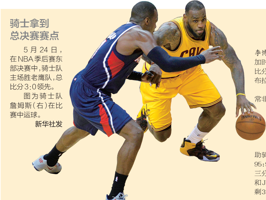
骑士拿到总决赛赛点