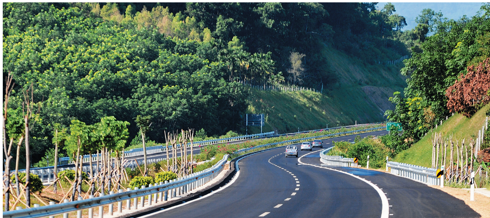
5月30日,屯琼高速正式通车。