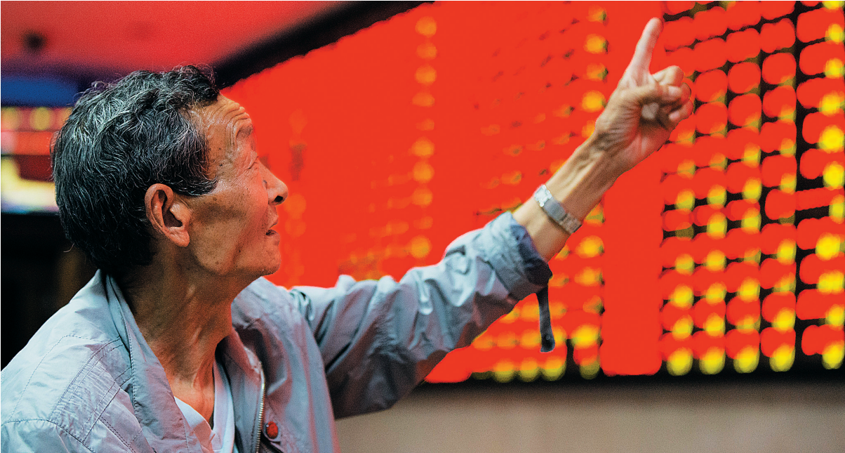
6月2日,股民在南京一证券营业厅关注股市行情。

“从长期看,如处于成长期的企业能够抓住发展机遇迅速成长,从长期看反而更符合投资者的利益。”王剑辉说。 (新华社广州6月3日电)