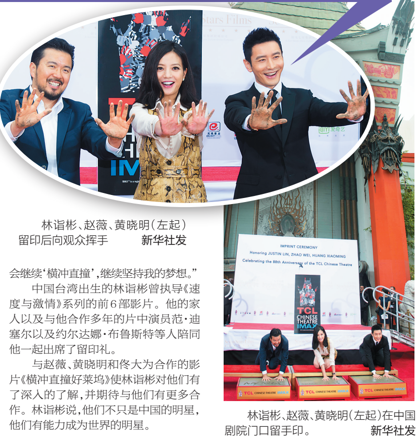
林诣彬、赵薇、黄晓明(左起)留印后向观众挥手

在的地方有一个自己的印记,这是对自己的肯定。” 赵薇在留印礼上还回忆起去年在大剧院门前与林诣彬和黄晓明合拍《横冲直撞好莱坞》的场景。“去年11月有机会和林诣彬导演合作,他是我们马上上映的新电影《横冲直撞好莱坞》的监制和编剧。这两个月在美国的拍摄给我留下了非常深刻的印象。在中国大剧院门口我们也拍了一场非常重要的戏。” 她还说:“与林诣彬导演以及所有美国工作人员一起工作,我觉得我学到了很多电影方面的知识和经验,对于我以后从事不管演员还是导演的工作都是非常宝贵的经验。洛杉矶的中国大剧院对于我是非常幸运的地方”。 黄晓明回忆起多年前与赵薇同窗的岁月。他说:“15年前我和赵薇是北京电影学院的同学,那时我是一个傻小子。经过15年的‘横冲直撞’,就像我们的电影一样,不小心就稀里糊涂撞到了好莱坞。今天作为中国大陆的第一个男演员在这个地方按手印,我觉得非常非常幸运。” 他认为,他们两人的幸运“也是因为中国电影越来越强了,对我们的重视程度越来越高。”他说:“在接下来的15年我