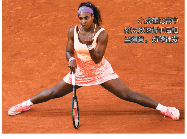
小威在比赛中劈叉救球得手后相当得意。

本报讯 北京时间6月5日晚,法网男单首场半决赛战罢,8号种子、瑞士选手瓦林卡经过激战以3:1(6:3、6:7、7:6、6:4)击败本土球手14号种子特松加,率先打入决赛。 (小新)