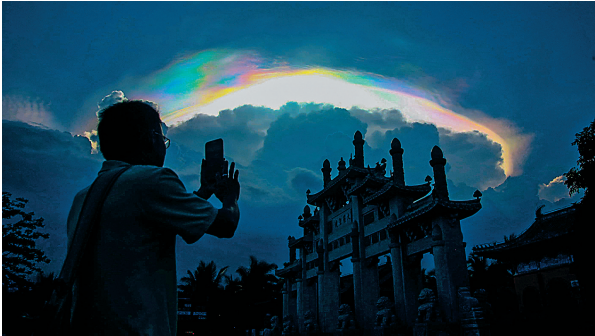
→2014年5月31日傍晚,海南省定安县西部天空出现绚丽的“七彩云”,吸引了众多行人观赏这色彩不断变化着的天象奇观。 海南日报记者 张茂 摄