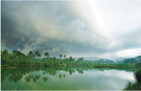
↑2005年7月23日,陵水椰子岛迷人风光。