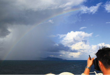
↑游客在椰香公主号上拍摄海上一半日出、一半雨的奇景。