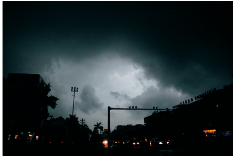
↑2014年4月3日下午,儋州市中兴大道突然乌云密布,整个城市瞬间被黑压压的乌云笼罩着,白昼如同黑夜一样,街道上的汽车不得不开灯行驶。