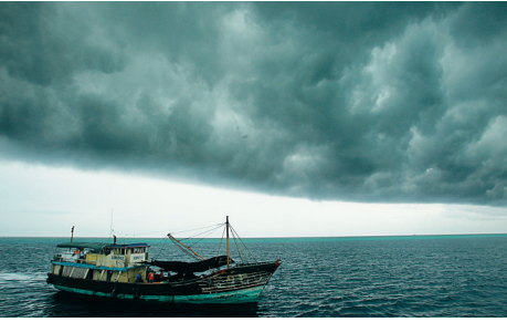
↑2012年7月6日,三沙市西沙晋卿岛海域乌云密布,附近作业的琼海潭门渔船前往避风。