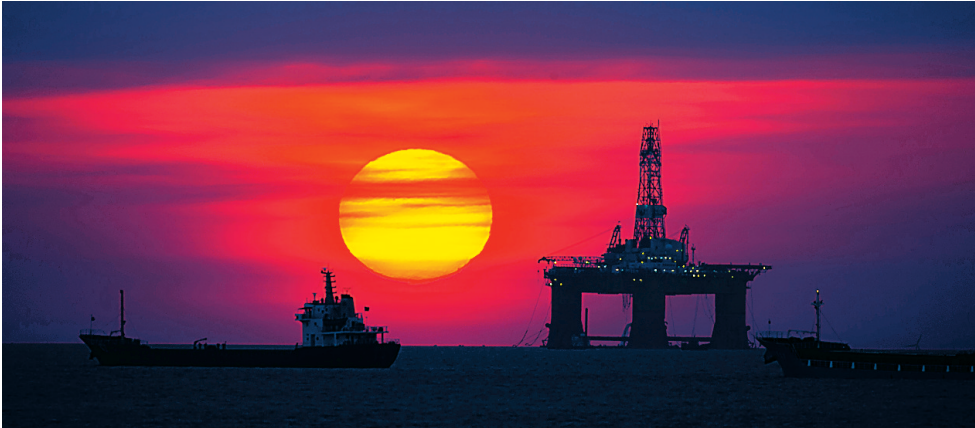
→2015年6月1日傍晚,一轮红日挂在海口湾的海面上。