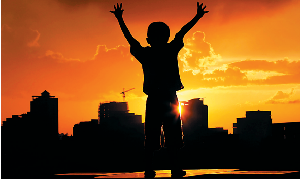
→2009年7月1日傍晚,海口西边天空出现火烧云奇异景象,一名小朋友不禁拥抱“夕阳”。