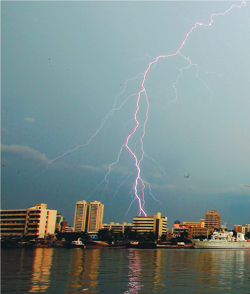
↑2013年5月26日下午,大雨过后的海口市,出现闪电、彩虹及火烧云等景象,这些盛夏里时常出现的天气现象,展示了海口的另一种美。生活在这座城市里的人们,纷纷利用相机、手机等记录这些美景,并通过微博、微信等自媒体手段发布,在网络上引起网友们的阵阵赞美与艳羡。