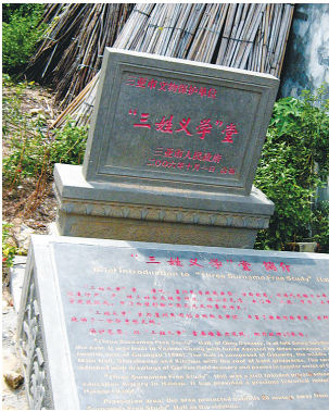
三姓义学堂门前的文物碑石。

际，给老师封一份“束修”，或是谷子，或是咸肉条，以表对老师的敬意。起晨坊的年少弟子，都是在这里接受四书五经的启蒙教育，从而踏上了今后的求学之路。 可以说，三姓义学堂作为清末年间崖州地区私学的代表，与官办学宫共同形成一个完整的儒家教育体系。直至清光绪三十年(公元1905年)废除科举，广推西学教育体系，三姓义学堂作为封建社会传统儒教的缩影，步入现代后，就渐渐式微了。但是正所谓“十年种树，百年育人”，学堂给当地人民教化启蒙的深远影响至今仍然存在。 “崖州城区从古至今，基本没有失学儿童，这和当地人重视教育的传统有关，无论粮食多紧张，再穷再苦，都要让孩子读书。”何擎国说，三姓义学堂为当地启蒙教育的普及做出了贡献，是三亚民办小学教育的缩影，也是当地人尊学重教的象征。 “起元村里出过造原子弹的科学家，很神秘的，还有在海外留学的博士呢。”村里的老人说起这些，脸上洋溢着自豪的神情。