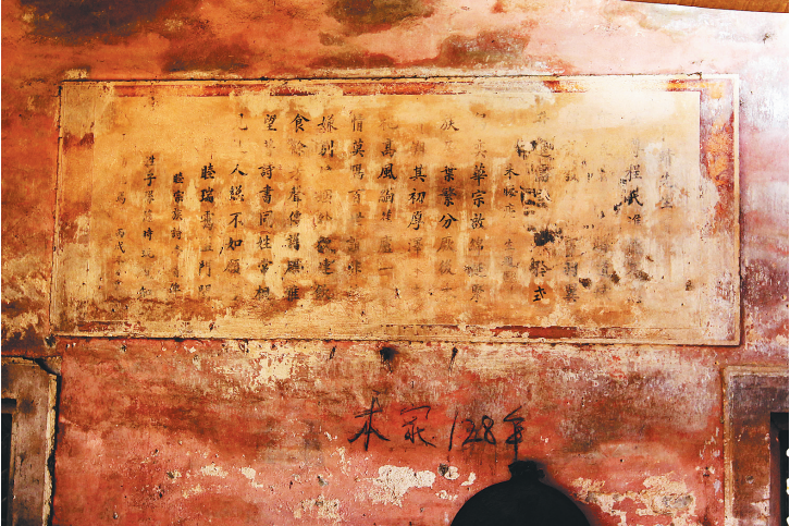
三姓义学堂中厅壁上刻的诗文。

“万般皆下品、惟有读书高”，尊礼重教的传统在古崖州人民中一直存在。然而到了清朝，科举制度发展到最后阶段，崖州人才也逐渐衰落。有史料记载，整个清代崖州无一人中进，其中崖城籍人仅有1人中举，恩贡3人，拔贡5人，岁贡20人，著名文人也没有前朝多。 这让崖州有志之士看在眼里、急在心里，于是起晨坊中一些有实力的姓氏大族为了重振教育，几家凑一块，集资办学、广置学田、捐献膏火，建一个学堂供族内子弟启蒙求学。“三姓义学”学堂就诞生在这个背景下。 “三姓义学”学堂建成当年有着怎样的盛况，后来又是怎么变成了居民之家，如今作为三亚市文物保护单位，这座垂垂老矣的清代古建筑会有一个怎样的未来？