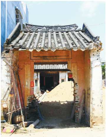
三姓义学堂目前仅存的门楼、中厅、正堂建筑。

清朝光绪十二年(1886年),崖州城启晨坊(起元村)尹、卢、林三姓族人为了自家子弟的教育,合力建起了三姓义学堂。从此,起元村里有了朗朗书声。然而,已过百年的义学堂如今再无小童的嬉戏与朗读,只遗了断壁残垣。