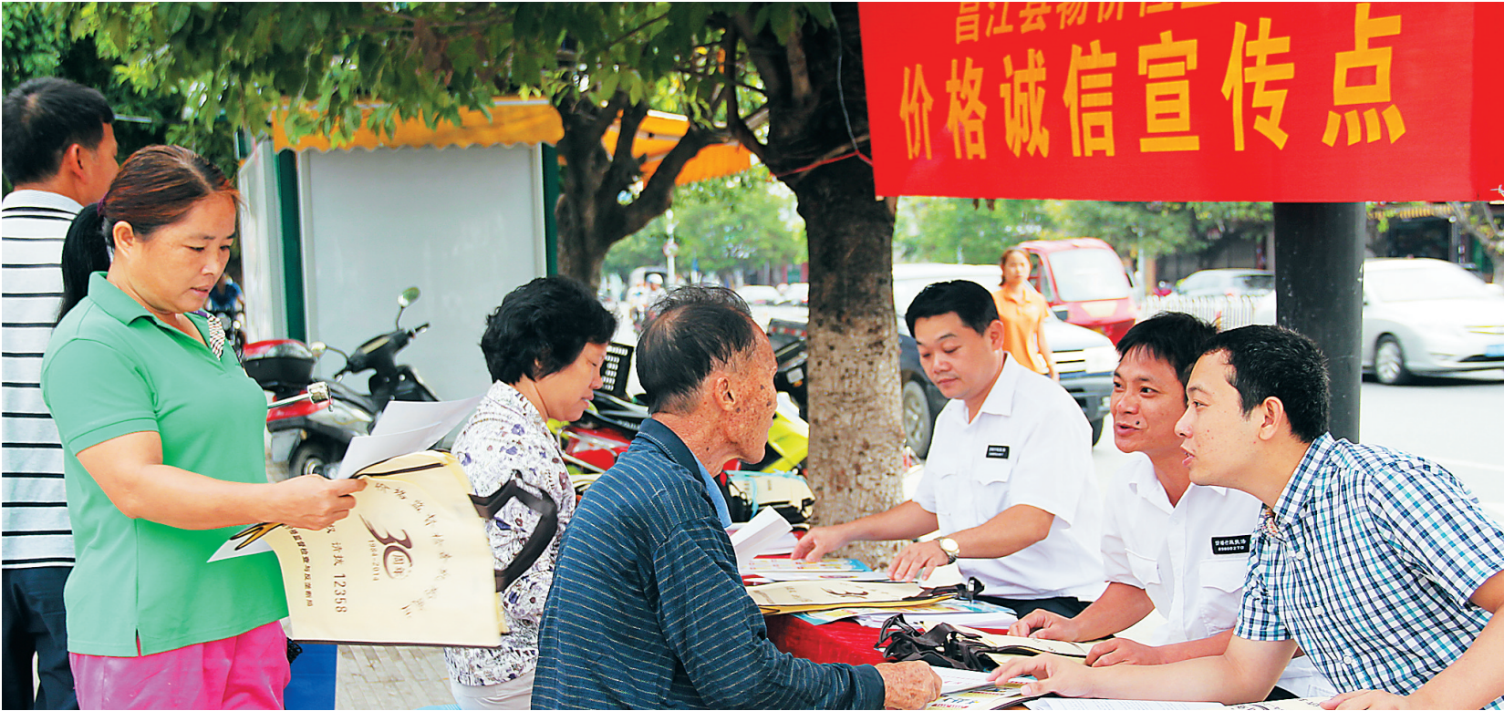
市民咨询有关价格问题。

目前，除了少数重要商品和服务价格由政府制定外，95%以上的价格已经放开由市场形成，价格机制配置资源的基础性作用得以发挥。但市场机制并非完美无缺，价格机制自身存在自发性、盲目性和信息不对称等缺陷。经营者在趋利动机下，往往利用甚至放大这些内在缺陷，实施价格欺诈、哄抬价格、价格倾销、价格垄断等进行牟利，这些违法行为扭曲了价格信号，导致“市场失灵”，严重损害消费者和其他经营者的合法权益，不利于技术创新、优胜劣汰和企业竞争力的提高，影响市场经济的效率 and 公平。