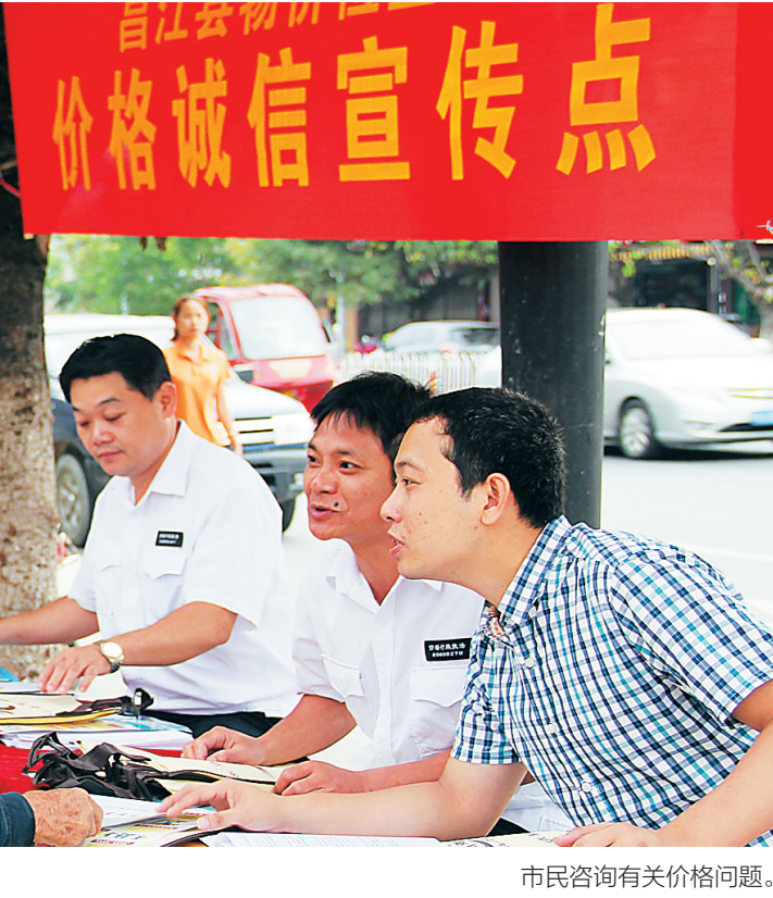
市民咨询有关价格问题。

我省价格主管部门不断加大市场价格行为监管力度，以“反欺诈、反垄断、倡诚信、促规范”为主线，以规范明码标价为重点抓手，强力规范市场价格秩序。 近年来，我省大力整治旅游购物店串通涨价、虚假打折、虚假优惠；旅游餐饮及“农家乐”不明码标价、两套菜单；海鲜排档不执行明码标价管理规定；旅游景区景点擅自抬高门票价格、不执行规定的优惠措