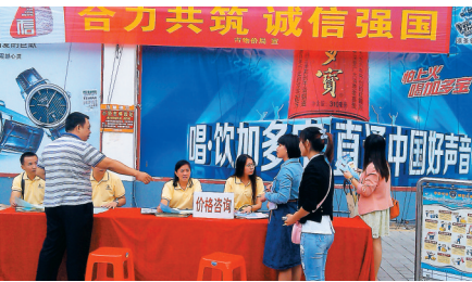
价格诚信宣传活动。

促销宣传未如实标示价格附加条件案。某零售商店开展促销活动，宣称预存50元抵200元，预存300抵800元，预存金额抵消消费金额都是有附加条件的，而当事人未标明预存金额使用附加条件。价格主管部门对当事人未标示附加条件的价格欺诈行为依法作出罚款30万元的行政处罚。