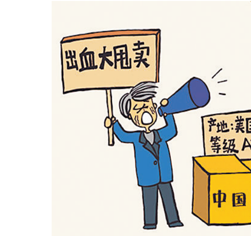
利用虚假的或者使人误解的标价形式或者价格手段，诱骗消费者或者其他经营者进行交易的，最高可处以违法所得5倍的罚款；无违法所得的，最高可罚50万元。