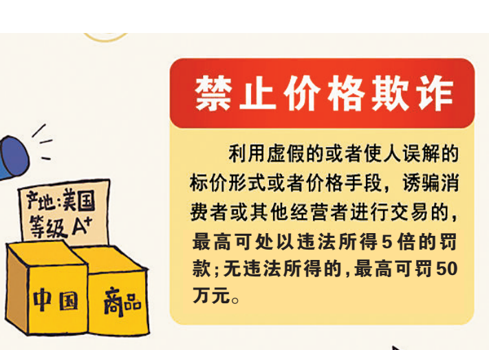
利用虚假的或者使人误解的标价形式或者价格手段，诱骗消费者或者其他经营者进行交易的，最高可处以违法所得5倍的罚款；无违法所得的，最高可罚50万元。

经营者构成价格欺诈行为应承担相应的法律责任，即经营者违反《价格法》第十四条规定，利用虚假的或者使人误解的价格手