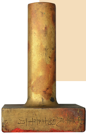
保亭县政府印边一侧镌刻“中华民国二十五年一月”