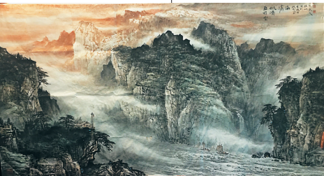
直挂云帆济沧海 黄迪全 作品