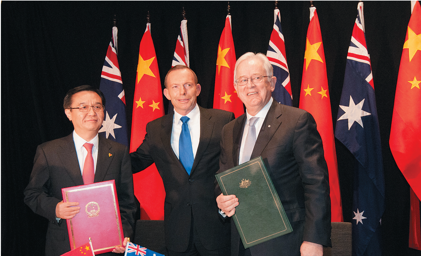
6月17日,中国商务部部长高虎城(左)和澳大利亚贸易与投资部部长安德鲁·罗布(右)在分别代表两国政府正式签署《中华人民共和国政府和澳大利亚政府自由贸易协定》后与澳大利亚总理托尼·阿博特合影。

同日,中国商务部部长高虎城代表中国政府在堪培拉与澳大利亚贸易与投资部部长罗布共同签署了中澳自贸协定。