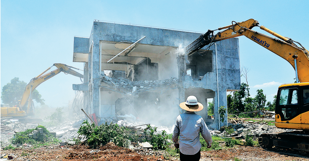
6月3日,海口市龙华区薛村范围内的违法建筑被依法拆除。

一位业主对记者表示,刚刚建好的农家乐就要拆除不心疼是假的,但更多的是理解,因为政府并不是冲着他们个人来的;另一位业主则表示,自己从小生活在南渡江边,对南渡江感情很深,通过政府工作人员思想教育,得知自己的农家乐营业后将