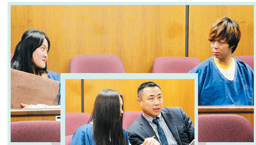
3名成年被告在法庭上。

3名被告身着蓝色囚服,双手被绳索束缚。 法院18日公布的起诉书内容显示,上述3名被告行为严重触犯美国刑法,共受到6项绑架指控、2项折磨虐待指控和4项人身侵害指控,累计12项罪名。 男性被告持续不到10分钟。3人分别通过代理律师向法官表明,不承认检方指控的罪行。主审法官西尔纳将下次开庭时间确定在7月27日,并警告被告在此期间可与案件受害