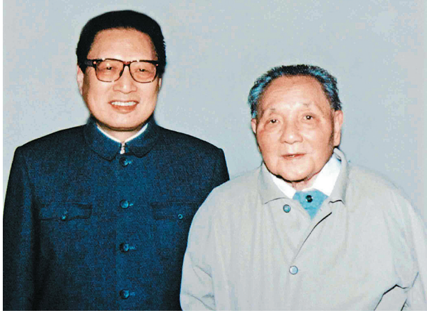
1992年10月，邓小平、乔石同志合影。