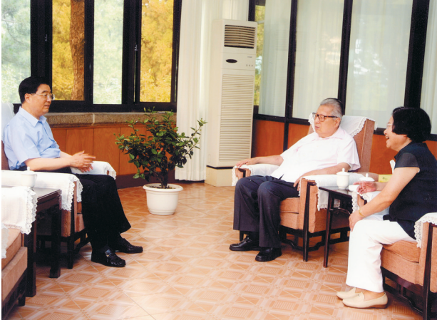
2009年8月，胡锦涛同志在北戴河看望乔石同志及夫人郁文。