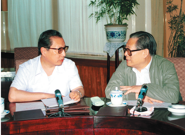
1989年7月，江泽民、乔石同志在中央政治局会议上。