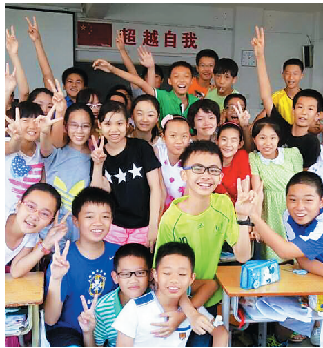
六(8)班的同学们。