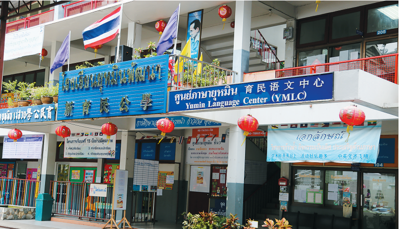
新育民公学。

国文化。”泰国海南会馆理事长陈文秋说,1947年他9岁时,父亲把他送回文昌读过两年书,学习中文与中国文化。“现在我们也与海南大学、海南师范大学、海南华侨中学建立了教育交流合作,每年由海南会馆派送学生到海南学习。海南一些学校也每年选派教师、学生到泰国