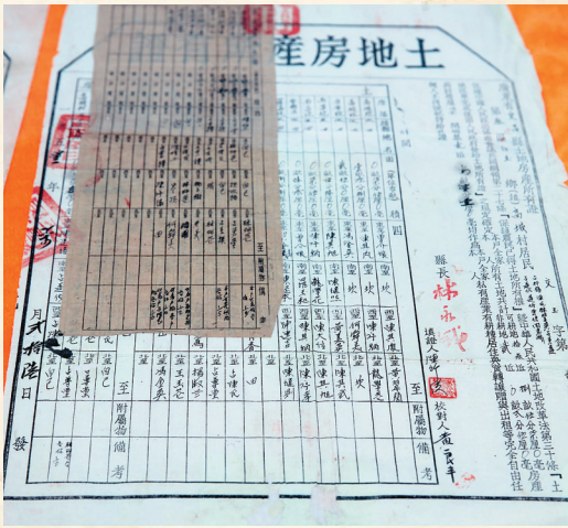
海南省档案局(馆)展出的广东省文昌县土地房产所有证。

就拿海口市房屋档案馆来说,该馆仅去年一年就对外提供房产登记信息查询14.7万宗次,共为9.85万人(单位)出具房产情况说明5.95万份,印签房产档案证明1.1万宗,有效调解了多起房产纠纷矛盾。