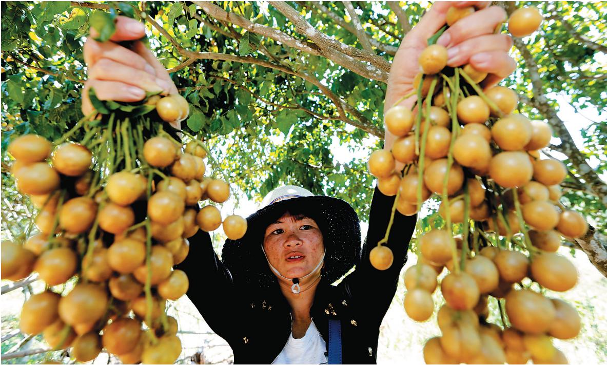
儋州大成镇南吉村黄皮喜获丰收。

2250毫米,特别适合黄皮生长,历年来以其果大、肉厚、汁多、籽少而著称。七八月间,该市农村的房前屋后,迎来黄皮果实的成熟期。大成镇是儋州黄皮