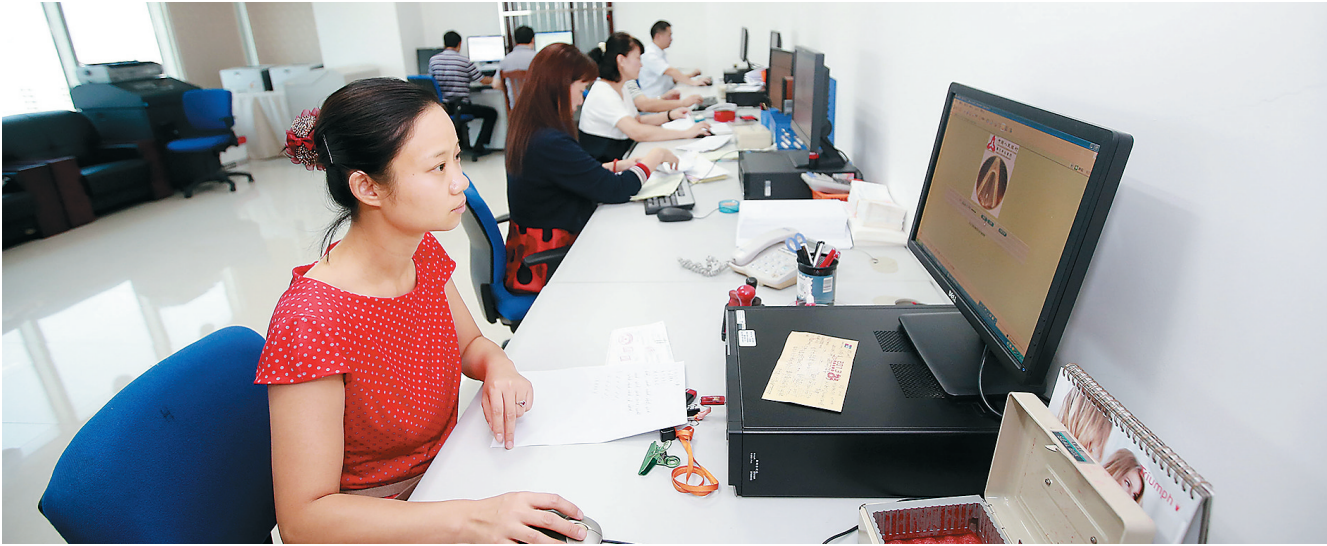
敬业勤奋的海口市中心支行工作人员。

政府预算执行效率、服务社会民生等方面发挥了重要作用。 30年来,人民银行以市场需求为导向,与有关部门不断完善国债管理机制,丰富国债品种,为国家经济建设筹集了大量资金,国债发行、兑付工作得到承销机构和投资者的广泛赞誉。 30年来,人民银行依法履行国库监督职能,确保预算收入准确、完整、及时上缴国库,预算支出严格按照预算执行,圆满完成了国家和人民赋予的“把关、守库”的神圣使命。 30年来,人民银行建立了优势互补、相互促进、信息共享的国库资金运行分析体系,为国家宏观调控和各级政府的决策提供了重要的信息支持和参谋服务。 30年来,人民银行建立了分工协作、服务宏观调控全局的国库现金管理工作机制,提高了国库资金使用效益,促进了财政政策与货币政策的协调配合。 回首过去,人民银行经理国库事业蓬勃发展;展望未来,全国各级国库正朝着现代化服务型国库的宏伟目标阔步前行。