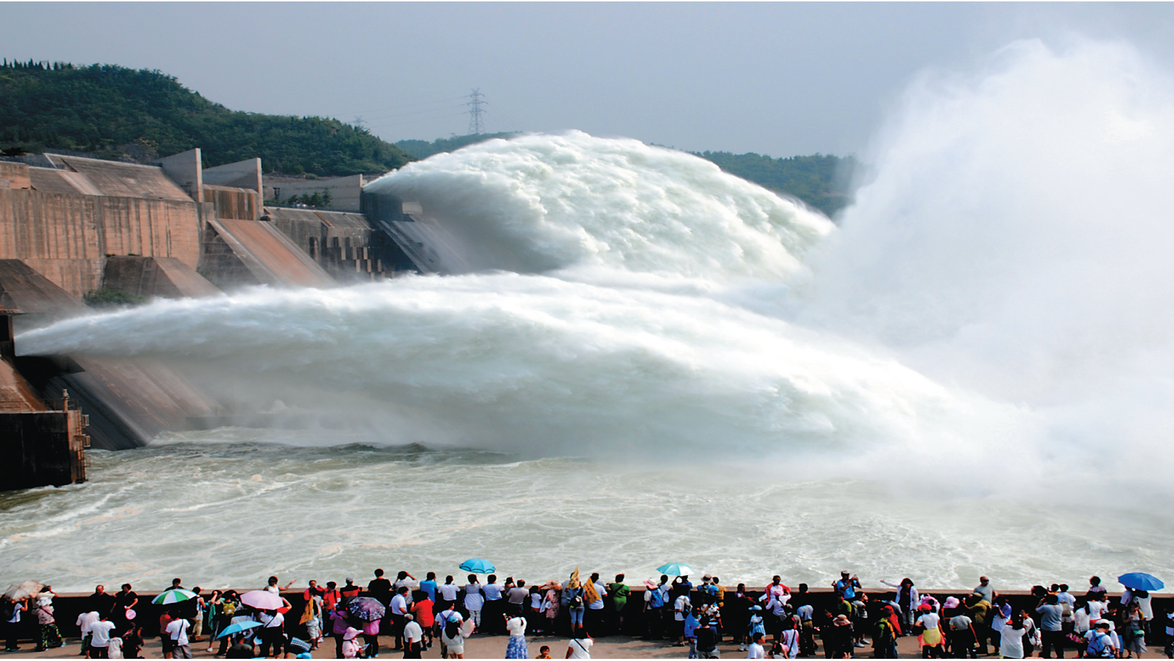
7月5日,游客在河南济源观看黄河小浪底调水调沙。自今年6月开始调水调沙后,大坝下泄量逐渐达到3600立方米每秒的峰值,小浪底进入最佳观瀑期。新华社发

中央全面深化改革领导小组第十四次会议日前审议通过了《环境保护督察方案(试行)》《生态环境监测网络建设方案》《关于开展领导干部自然资源资产离任审计的试点方案》《党政领导干部生态环境损害责任追究办法(试行)》等文件,引起社会的广泛关注和热烈讨论。 有干部和专家表示,四份文件从不同的层面规定了生态建设的新动向,创造性地提出“党政同责”、领导干部自然资源资产离任审计、损害生态环境终身追责等,表明了中央在加强生态建设方面的决心和信心,释放出明确的政策信号和制度导向。