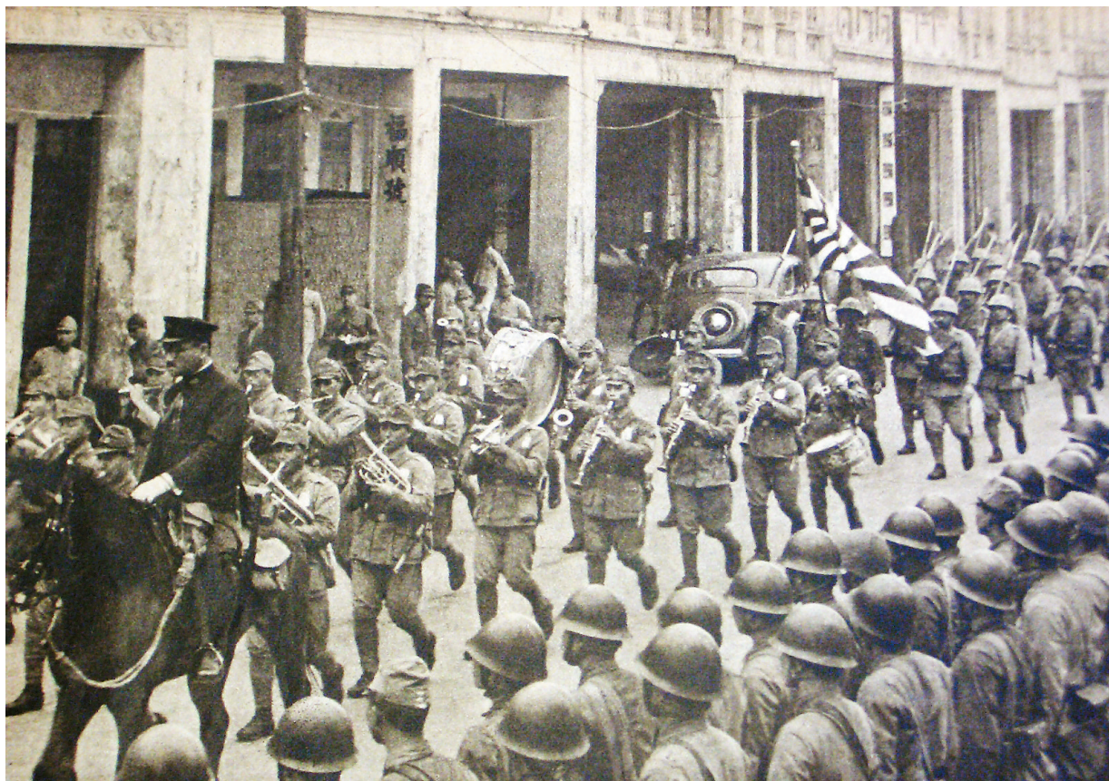
日军占领海口后,在中山路举行入城仪式。