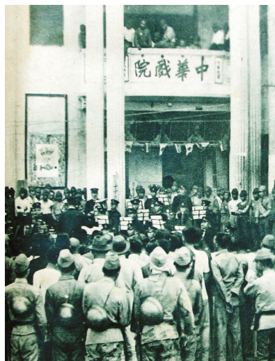
日军在海口中华戏院看表演。