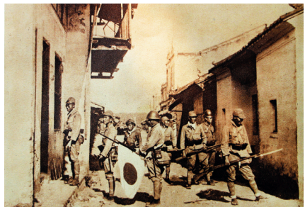
日本军队在文昌一带的巷战。