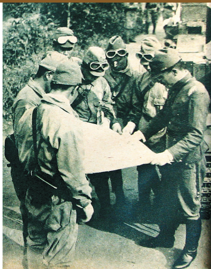
日军在海南岛作战途中。