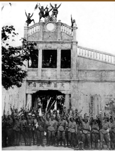
日军占领文昌县政府。