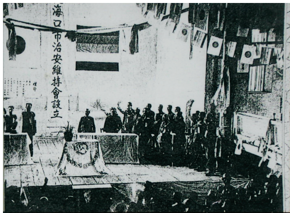
1939年2月22日,日军在海口市设立维持会。