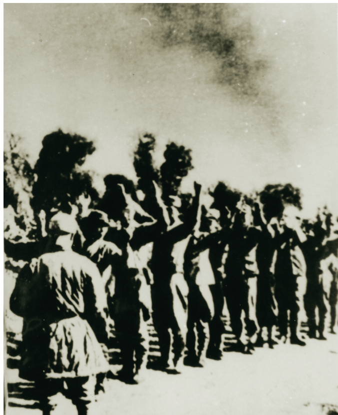
1945年,日军兵败如山倒。8月15日宣布投降后,海南岛的驻军也陆续投降。