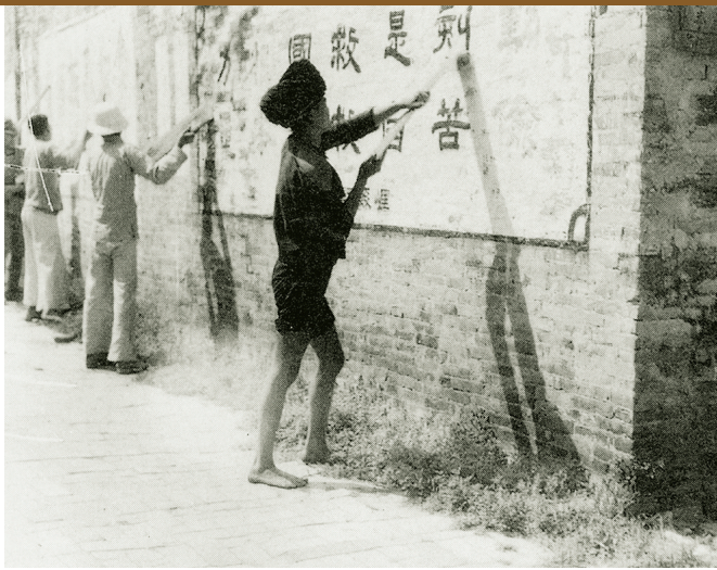
日军占领崖城后,勒令当地老百姓铲掉墙上的抗日标语。