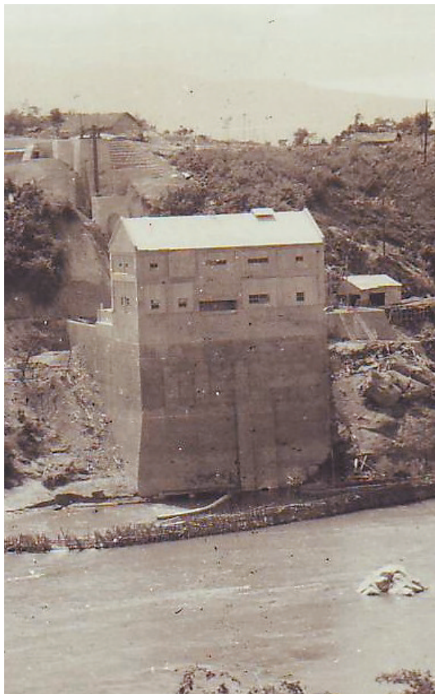
建成后的东方发电所。