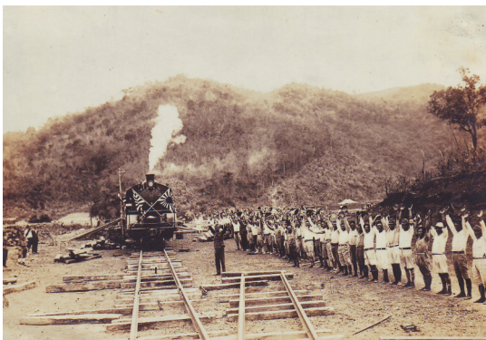
1942年4月1日,石碌铁路开通仪式。