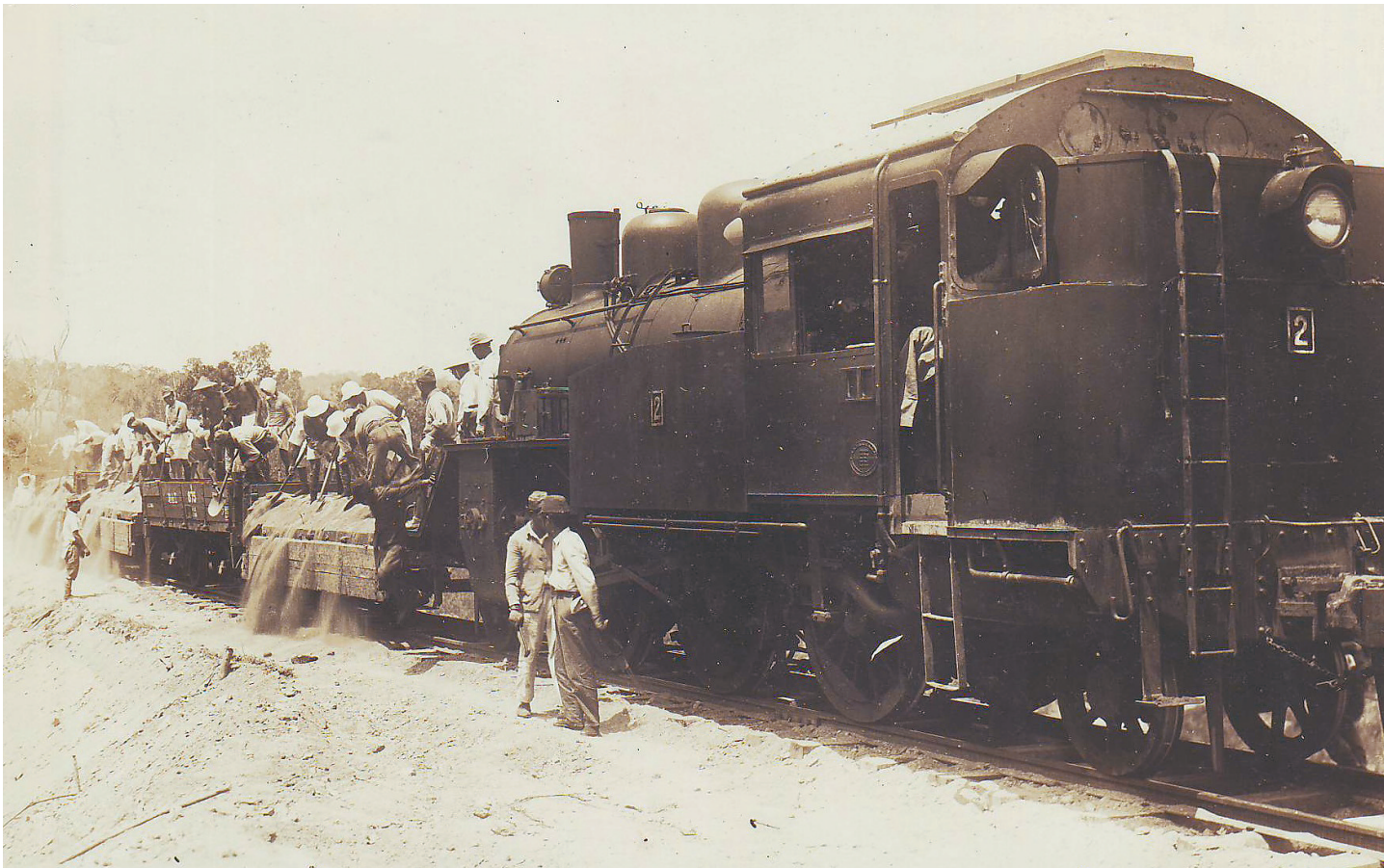
日本掠夺开发石碌铁矿。(本版图片除署名外由金山供图)

日本人还对三亚的田独铁矿进行掠夺,并开采屯昌羊角岭水晶矿,同时大量掠夺其他矿产资源如钨、锡等。此外,日本还对海南岛的热带资源进行掠夺。——编者