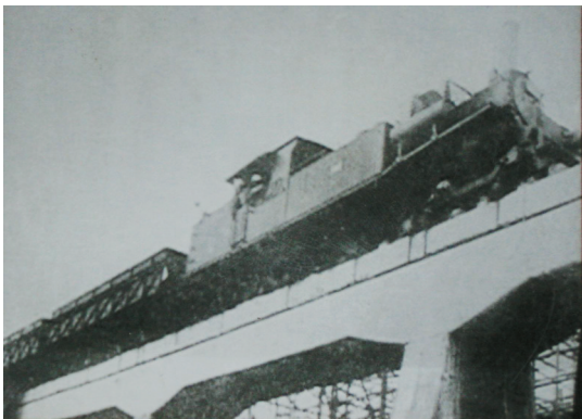
在八所高架桥上掠走矿石的日本列车。