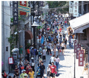
海口观澜湖华谊冯小刚电影公社。

为保障此次活动的质量，酷秀和海口市旅游委共同发布了“诚信保障金”政策，承诺凡购买此次活动销售的产品的游客，如发现信息不真实、误导消费等问题，酷秀旅游平台将先行退款，实行双倍赔偿。