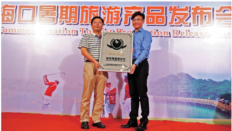
7月6日，海口观澜湖旅游度假区举行国家4A级景区挂牌仪式。

本报海口7月6日讯（记者许春媚 通讯员钟礼元）今天下午，海口观澜湖旅游度假区举行了国家4A级景区挂牌仪式。据了解，这是继海口假日海滩旅游区、雷琼海口火山群世界地质公园、海南热带野生动植物园三个4A景区后，海口又增添的一个国家级4A景区。近年来，省及海口市旅游相关部门及专家组高度重视海口观澜湖旅游度假区的建设和发展，多次实地考察后指出，海口观澜湖已经成为海南重要旅游窗口，通过继续优化旅游资源，创新项目建设，将增色琼北旅游的发展。经过度假区不懈努力，终于打造出海口的又一块国家4A级旅游景区牌子。海口观澜湖度假区作为琼北旅游的一大旅游吸引物，在推进旅游项目建设的同时紧扣“科学发展”与“绿色崛起”两大主题，倡导可持续旅游。海口观澜湖旅游度假区将低碳环保、节能降耗的理念融入建筑设计、企业文化之中，并以顶级高尔夫国际赛事为亮点，兴建集运动、赛事、保健、养生、文化、娱