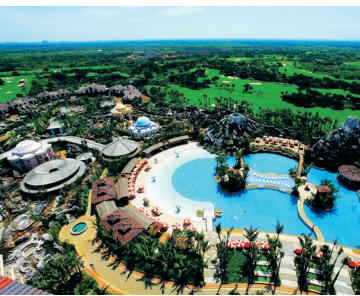
海口观澜湖温泉及水上乐园。