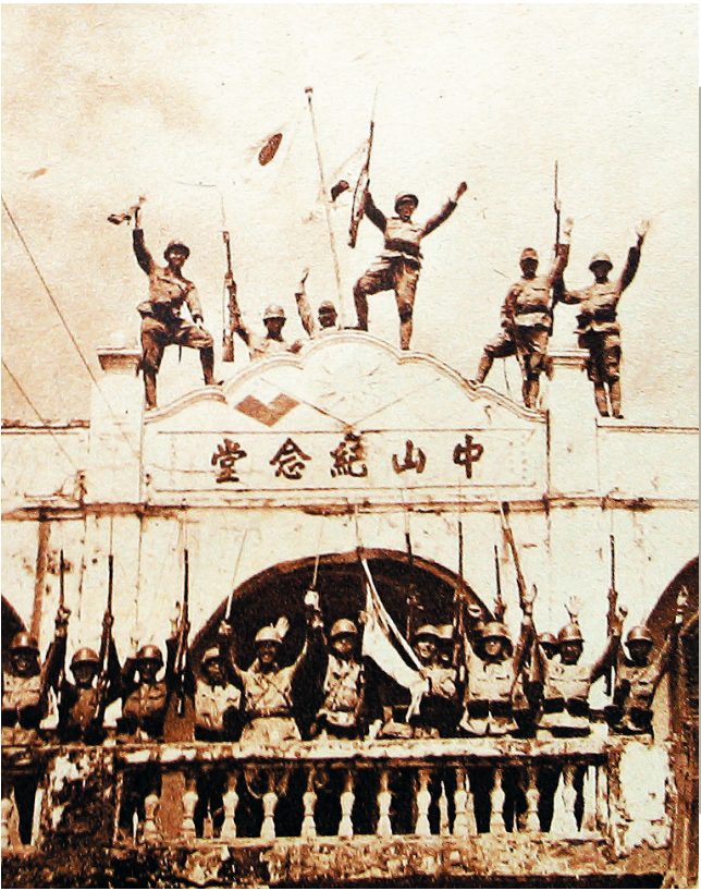
《画报跃进之日本》杂志刊登的日本军队侵占海南定安中山纪念馆的图片。