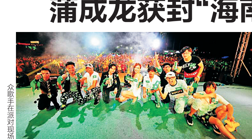
众歌手在派对现场

本报讯(记者王黎刚)珠江纯生啤酒派对携手侧田等明星近日在海口体育馆广场上演了一场精彩纷呈的玩乐潮趴。玩乐学院首次登场,侧田与唐紫睿、蒲成龙等一众明星歌手和现场观众掀起了一股玩乐狂潮。珠江纯生网络玩“乐”真人秀的晋级赛同台开展,三亚唱作才子蒲成龙凭借出色的