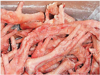
许多走私冻鸡翅是“肉龄”高达数十年的“僵尸肉”。

而在海南，打击这种问题冷冻肉及肉制品行动早在2014年已经大规模开展。去年以来，我省共计开展5次大规模打击走私冷冻肉类食品专项行动。经过全省食品药品监管部门上下联动重拳打击，一年多来共查处各类走私肉类食品逾270吨，查获涉嫌走私的鸡爪、猪肚、牛排、牛肚等10多个品种，分别来自美国、日本、阿根廷等10多个国家和地区。我省走私冷冻肉及肉