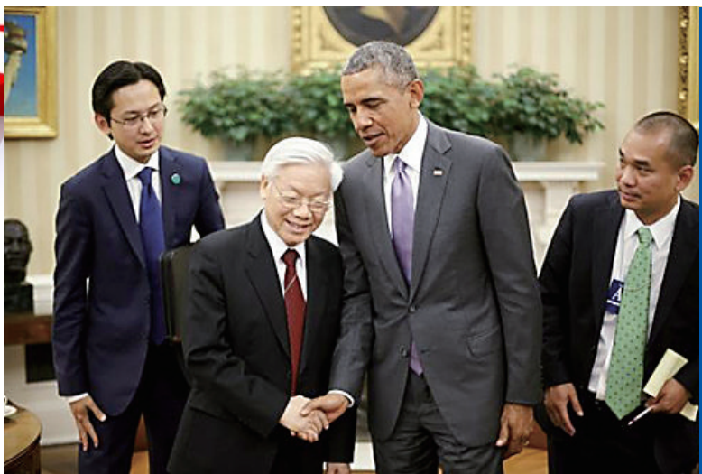
当地时间2015年7月7日,美国华盛顿,越共中央总书记阮富仲访问美国,美国总统奥巴马在白宫椭圆形办公室与阮富仲会晤。

美国媒体认为,奥巴马高调邀请没有任何政府职务的党魁访问,旨在推动美越经济和军事合作,尽力促成TPP方面的突破。分析人士说,在奥巴马政府力推的“亚太再平衡”战略中,越南是一枚关键棋子。通过在白宫椭圆形办公室接见这种象征性姿态,奥巴马实际上传递出信息:美国已经认可越共是越南的最高领导力量。美国夏威夷安全研究学会亚太中心安全专家亚历山大·维尔维茨认为,阮富仲访美表明两国利益有交汇点,也反映出越共高层国家战略的逐步调整。去年,美国宣布部分解除对越南出售杀伤性武器的禁令。美国一些分析人士表示,阮富仲希望以访美为契机,进一步要求美国解除武器禁运,向越南提供先进的海空军硬件和软件。美国传统基金会亚洲研究中心主任沃尔特·洛曼说,虽然阮富仲访美是越南战争结束40周年两国关系发展的一个标志性事件,但并不意味着美越准备成立“联盟”。他表示,越南寻求在大国之间的平衡点,其行动均以越南的国家利益和战略视角为出发点。这也是不少美国专家的看法,即越南善于在中国、俄罗斯、印度和美国等区域和世界大国之间寻求平衡,因此不会为了得到美国的一些好处而完全倒向美国阵营。(据新华社电)