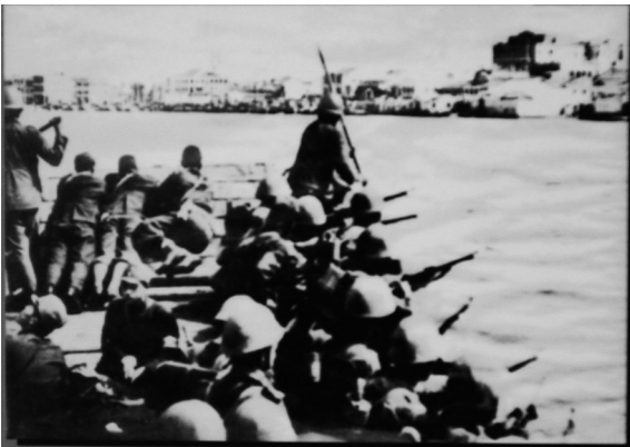
日军登陆艇在扩卫舰掩护下，在海口长堤码头登陆

日本军队实际上在1939年2月9日夜间集结于澄迈湾一带，陆军分成左右两翼，正面间隔一千五百米，左翼部队在凌晨3时50分开始在天尾港一带登陆，右翼部队在4时5分开始登陆；海军方面，日军在其航