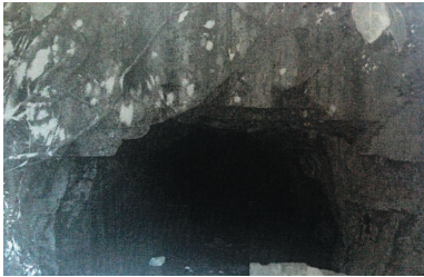
陵水南湾日军巡艇航道遗址