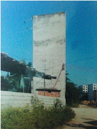
白马井镇日军碉楼遗址