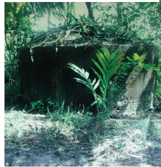
陵水英州大坡村日军碉堡旧址

应该说,日军对海南岛战略地位的认识,是一个“量变”过程:即随着日军对海南岛战略地位认识的不断深入,其在海南岛的驻军也在不断地变化,相应地反映为日军在海南岛登陆后的兵力配置的变化。海南日报记者近期在专家指导下进行了实地走访,在海口、陵水、三亚、保亭等地遗留下来的日军侵琼遗址昭昭见证着70多年前的那一段灰暗往昔。