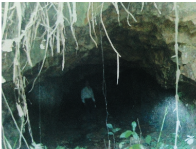
保亭南林日军坑道遗址