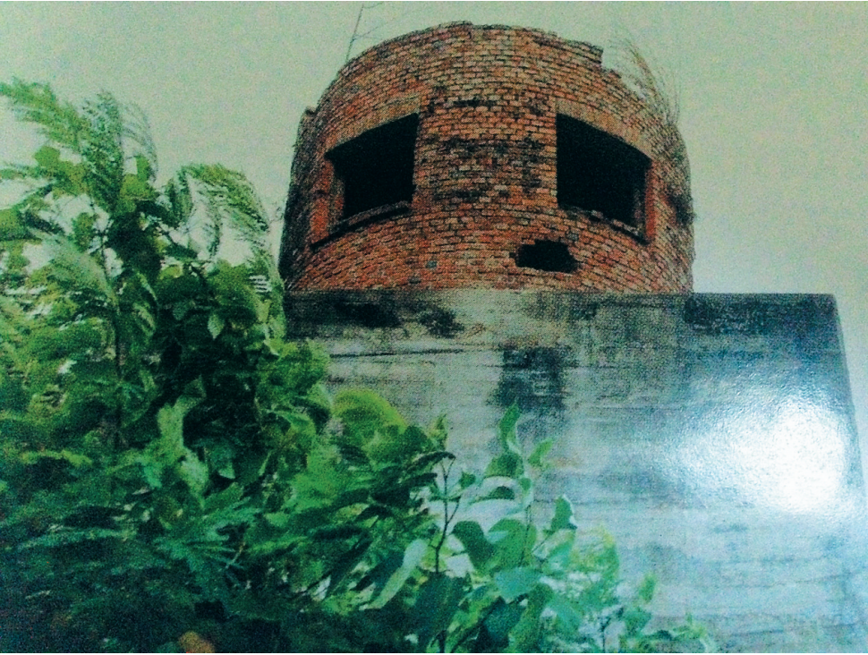
石碌日军炮楼旧址

逾百艘『自杀式快艇』暗藏海岛坑道 ◀上接B04版 碉堡炮楼兵营据点遗址 为掠夺资源监控日常活动大量修建 走访中,侵琼日军根据军力配置所建设的碉堡炮楼遗址在今天的文昌、儋州、陵水、昌江、保亭、海口、三沙等多市县可见。 文昌市会文镇琼文中学校园内,一幢T字型破旧的二层小楼在椰子树的掩映下似悠悠讲述着那一段历史沧桑,这里曾是侵琼日军文昌白延驻兵据点旧址。日军侵琼期间,在海南各地大量修建了碉堡炮楼和驻兵据点,而这里的楼房也是当时日军在白延地区修建的兵营所在地,其建筑劳动力全是被日军强征服苦役的当地老百姓。 琼文中学的这一出据点楼就是始建于1940年,坐西北朝东南,356平方米的建筑面积。而类似此据点,以陈旧斑驳景象存在的遗址,还有位于儋州白马井镇捞地海岸的白马井日军碉楼遗址。如今这一日军碉楼的位置已被开辟为当地的一家小饮食店。当年日军台湾混成旅团第52联队海军陆战队在白马井港登陆,其后便由一个60多人组成的小分队驻守,分队部最初设在伏波庙,后来为了占据有利位置,日军在马捞地新建了兵营,也就是白马井碉楼遗址所在地,日军在碉楼上监视着白马井居民的日常活动,而马捞地碉楼周围装备有汽车、轻机枪、步枪等武器。 保存较为完整的还有昌江石碌炮楼和陵水大坡村的日军碉堡旧址。 今天石碌镇石碌矿山西北角的一座小山上,红砖筑砌起来的炮楼见证了日军疯狂掠夺海南矿产资源的历史;在陵水英州镇大坡村西南边,一座在丛林中的碉堡很是显眼,碉堡坐东向西,呈一个圆柱形,顶部像锅盖一样,整体是钢筋水泥结构,直径有3.4米。碉堡的东南北三面各开了一个枪眼,枪眼是喇叭口状的,外围还用沙土覆盖到了枪眼的低端,碉堡的底座用红砖砌成。 值得一提的是今天在三沙永兴岛宣德路上的永兴日军炮楼旧址。高9米、三层砼结构的炮楼四面开大窗,楼顶垛墙开满花窗,占据了永兴岛西侧制高点。我国南海诸岛的海上要冲位置极为重要,岛上和周边海域蕴藏了丰富资源,日军也对此觊觎已久。1939年占领西沙群岛后,日军在岛上构筑工事,企图长期占有,同时疯狂攫取磷矿资源,仅在永兴岛盗采的鸟粪就多达20余万吨。[5]