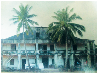
日军文昌白延驻兵据点旧址