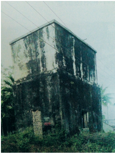
保亭什玲日军据点炮楼遗址