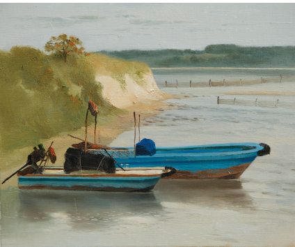
王锐 油画《静静的海湾》