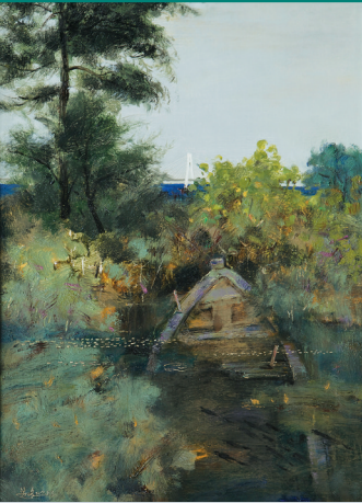
梁峰 油画《静静的时光》