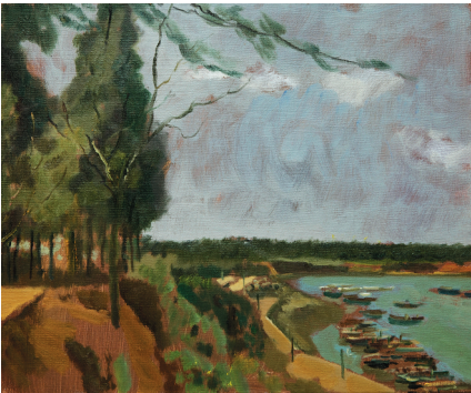
陈宜明 油画 山下的港湾