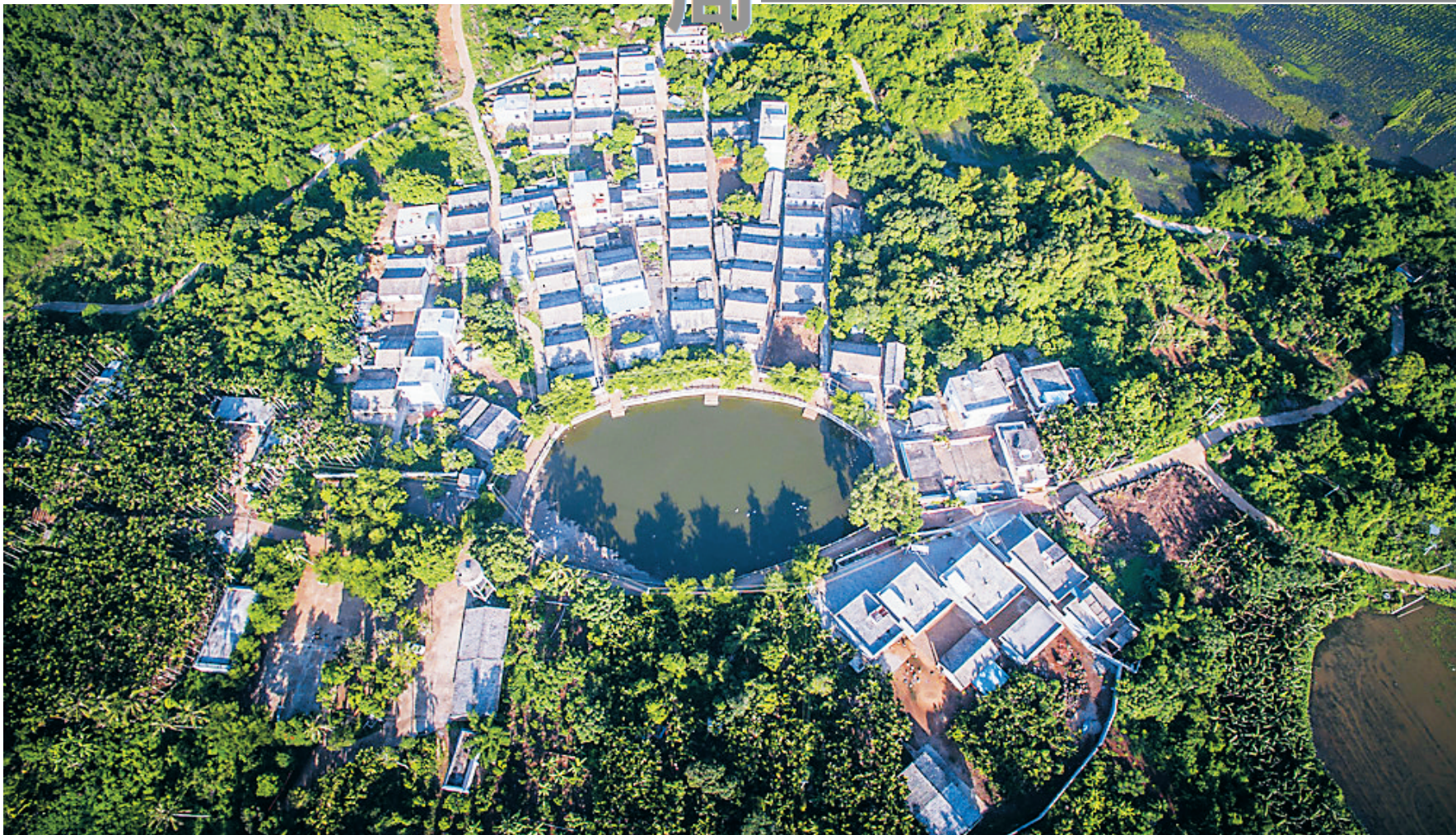
环绕着池塘修筑房屋的海口永兴冯塘村,已有400年的历史。