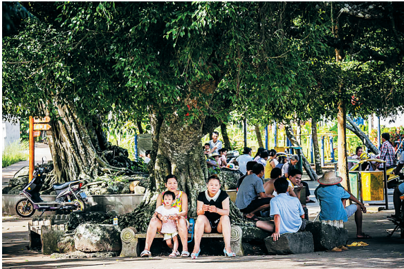
村口的大榕树是冯塘村男女老少纳凉聊天的好场所。