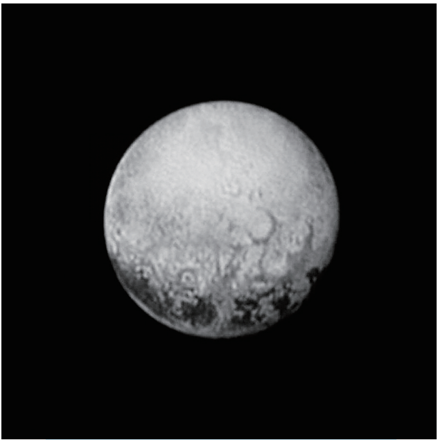
↑ “新视野”号探测器发来的冥王星迄今为止最清晰的图片。“近景特写”最早可能15日才能发布。

量。按照先前估算,冥王星气温可以降至零下240摄氏度。 “新视野”项目成员、华盛顿大学学者比尔·麦金农预计,探测器可以观测到冥王星上的环形山甚至火山痕迹,表面冰层下可能有液态的海洋和岩石核。“那些认为我们会找到冰冷死冰球的人们会大吃一惊,我希望看到一个充满活力的世界,”他说。 不过,科学家不能保证百分百的探测成功,直到“新视野”在完成最接近冥王星13小时后,如果它致电总部,才能确认。NASA预计,冥王星的“近景特写”最早可能15日才能发布,全部数据预计得到明年10月才能传输完毕。 庄北宁(特稿·新华国际客户端)