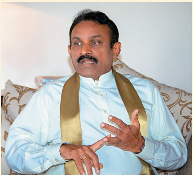
斯里兰卡南方省省督那纳亚克勒。

“一带一路”战略的魅力逐渐在印度洋释放,特别是在21世纪海上丝绸之路的沿线国家之一斯里兰卡日渐被认知和接受。 在海南省外事侨务办的牵线搭桥下,7月14日,斯里兰卡南方省省督那纳亚克勒在家中欣然接受了海南日报“一带一路”报道小组的专访。那纳亚克勒表示,中斯两国友好往来源远流长,两国经贸文化关系日趋紧密,斯方真诚欢迎中国投资者前来斯里兰卡投资创业,特别是在橡胶加工贸易、红茶、港口设施建设等方面尤其欢迎中国资本的进入,斯里兰卡也真诚欢迎中国游客前来观光旅游,为进一步增进两国交流合作贡献。