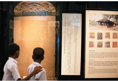
当地学生在斯里兰卡国家博物馆内参观馆内珍品“郑和碑”。