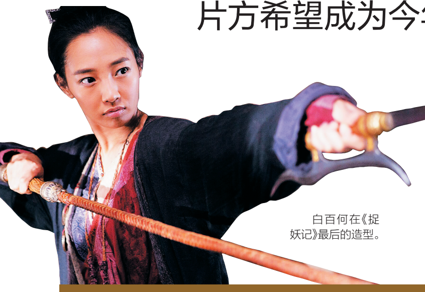
白百何在《捉妖记》最后的造型。

本 报 讯 7月16日公映的影片《捉妖记》在映首日18时打破《西游记之大闹天宫》创下的华语片首日票房纪录。稳坐实时票房第一。 此前,2014年1月31日公映的《西游记之大闹天宫》首日票房为1.289亿元,一直保持华语片首日票房纪录。而截至7月16日18点,根据猫眼票房的数据显示,《捉妖记》的首日票房已破1.3117亿元,并且还在持续走高。随着晚高峰的到来,《捉妖记》将创下华语影片首日票房的新纪录。