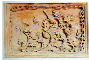
海口市旧州镇包道村侯家大院供案上的花板纹样。