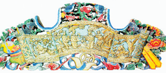
海口玉沙村庙檐廊梁架上的人物故事木雕装饰。