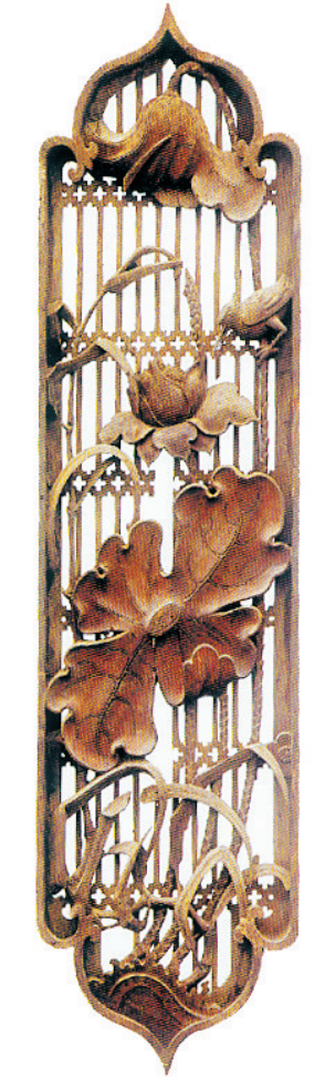
清菠萝蜜格透雕《一路连科》