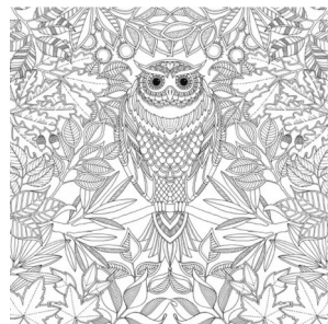
书中有一页是这样的。