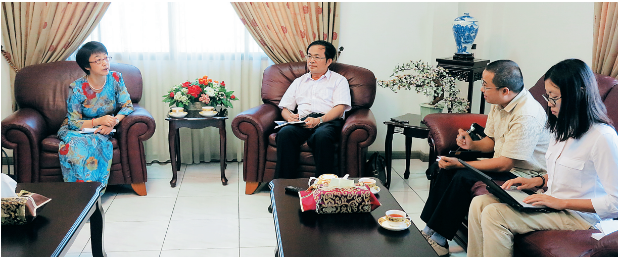
2015年7月20日，中国驻文莱大使杨健在大使馆接受海南日报记者专访。

“我们一见到祖国、见到海南来人就感觉亲切。”今天下午，中国驻文莱大使杨健接受海南日报记者专访时说，文莱与海南地理环境相似，有很多海南籍华人，她自己曾任外交部亚洲司副司长，也参与了博鳌亚洲论坛的创建和此后的多次年会，对海南有种特别的情愫。 杨健首先介绍了文莱悠久的历史。文莱古称渤泥，宋代开始与中国就有频繁的贸易联系。1247年宋朝泉州判院蒲宗闵出使渤泥国后病逝于此。渤泥是郑和下西洋时期海外诸国与中国关系最为密切的国家之一。“文莱几乎所有人都知道‘郑和元帅’的名字。”1408年，渤泥国王麻那惹加那乃远涉重洋，到中国友好访问，后不幸病逝于中国，明成祖将之厚葬于南京。1958年其墓地被考古工作者发现，从而成为中国与文莱古代交往的佳话。 中文两国关系非常友好，文化交流密切。杨健介绍说，文莱筹建海洋博物馆多年，因展品不够丰富，希望得到中方的帮助。经过大使馆牵线搭桥，我国的泉州海外交通史博物馆提供一批展品，与文方联合举办“碧海丝路，东方之舟”的展览，反响非常好。应文方要求，