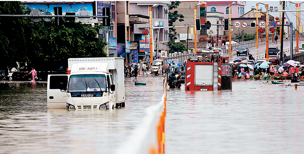
7月20日，在东方市八所镇，持续的暴雨使得部分街道出现严重积水。

暴雨红色预警信号。记者18时许再次来到东府路一带时看到，街面依旧宛如河流，积水严重。东方市政府有关负责人称，八所是老城区，排水工程建设不到位，每逢较大的持续降雨，城区便出现持久内涝。 截至17时，东方市三防办统计的数据显示，从7月19日上午8时以来，全市多个测报点平均降雨量已达231毫米，降雨集中在八所城区附近。降雨最多的是八所镇的红兴村，有541毫米，八所城区达到426毫米。 东方市38宗水库有18宗水库出现溢洪。其中，中型水库2宗，小型水库16宗，其他水库都有一半以上的蓄水。目前，水库没有出现险情。全市受灾面积25平方公里，受灾人口16.8万人，转移人口4230人（集中在八所城区和附近村庄），没有出现人员伤亡。截至记者发稿时，抢险工作仍在继续。