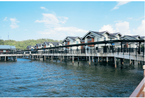
斯里巴加湾市最富特色的水上村庄。