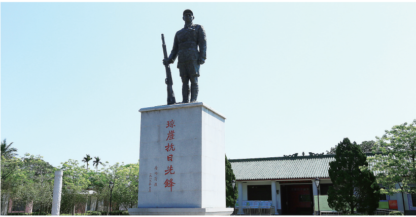
琼崖工农红军云龙改编旧址。