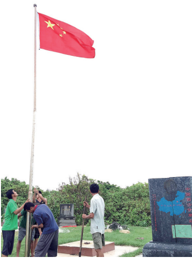
甘泉岛居民升国旗。

会议还审议通过了任免案，决定任命陈儒茂为三沙市人民政府副市长，会议表决通过了关于接受谭宏才辞去市工商行政管理局局长职务请求的决定。