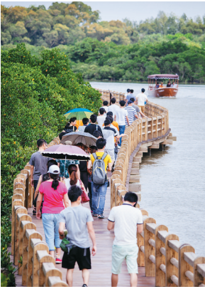
东寨港红树林生态旅游园区这座绿色宝库因规划控制、立法等得到较好保护。

“把全省作为一个大城市来规划建设”——这样的理念，自海南建省办经济特区以来被反复提及。然而，直到中央全面深化改革领导小组同意海南在全国率先开展省域“多规合一”试点，海南才真正走上了“全省整体规划建设”的快车道。 此次省委全会通过的《中共海南省委关于深化改革重点攻坚加快发展的决定》，将推进“多规合一”改革试点作为一项重要内容，彰显了海南不负中央重托，坚决排除各种困难，将全省“一张蓝图干到底”，为全国改革大局探路，提供可复制、可推广经验的坚定决心。 “一张蓝图干到底”，意味着海南必须抓住机遇，从国家对海南发展的定位和省情出发，落实全省“一盘棋”发展理念；意味着要坚守生态底线；意味着要加强规划制度创新；意味着要破除行政界线 and 部门壁垒，优化资源配置，建立全省统一的空间规划体系；还意味着要发挥试点对全局性改革的示范、突破、带动作用。