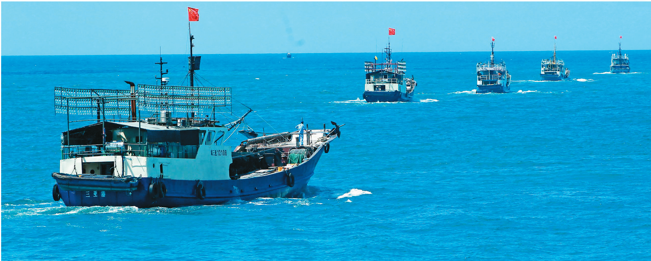
渔船队伍赴三沙捕鱼作业。