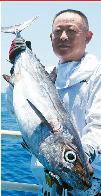
海钓爱好者在三沙钓鱼。

抓鱼、打牌、睡觉 曾是三沙渔民打渔生涯『三部曲』 如今，渔民开始摸索『洗脚上岸』 当上了『干部』 开起了渔家乐 搞起了深海养殖 …… 他们的日子越来越红火 越来越有奔头、有盼头、有甜头