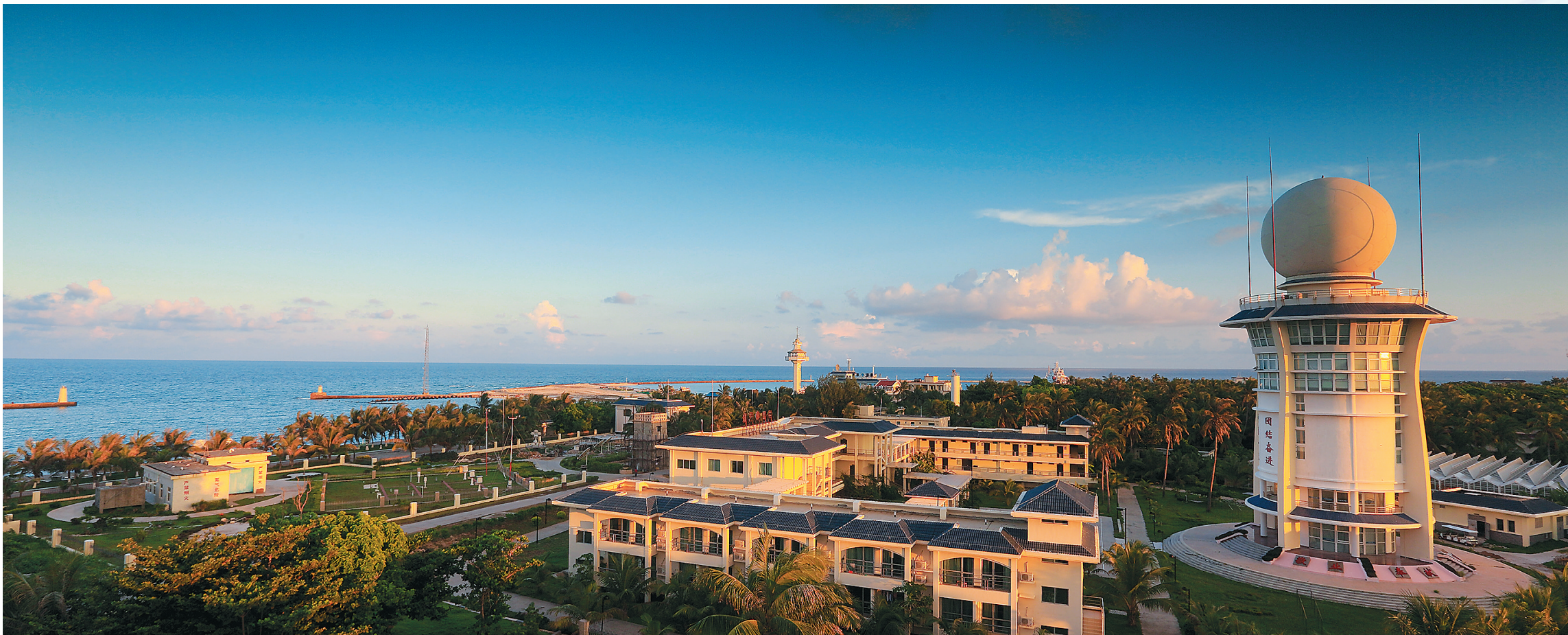
设市以来三沙永兴岛发生巨大变化,群众生活越来越好。

三沙的变化,是有口皆碑的。上学有学校,看病有医院,用电有太阳能,娱乐有广播电视,健身有体育馆,购物有商业街……3年来,三沙市以民为本,累计投入4.67亿元推进民生工程建设,每一项民生重点项目,三沙市都明确进展情况、目标任务、存在问题、解决措施和责任人,为每一个三沙人的幸福而奋斗。 而今,三沙居民的生活有了巨大变化,精神文化生活也变得越来越丰富。他们的笑容,源自内心;他们的感激,发自肺腑。