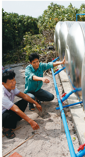
三沙北岛用上了海水淡化设备。

如今的三沙居民 看病有医院 用电有太阳能 健身有体育馆 购物有商业街 他们的笑容 源自内心 民生改善 让边陲小岛上 洋溢着幸福的气息