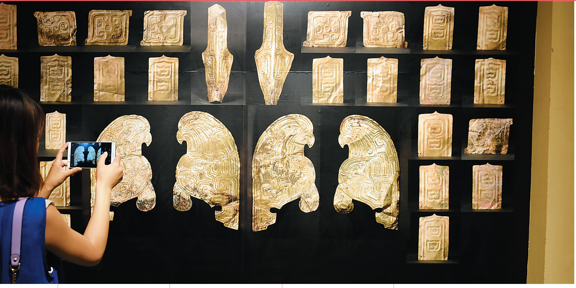
三十二件流失文物回国后展览图。