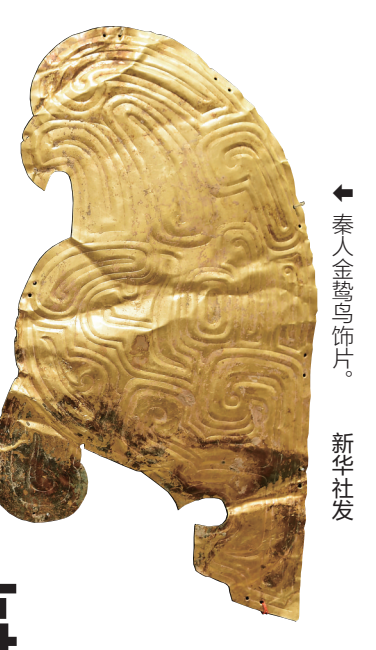
秦人金鸢鸟饰片。

如今再访大堡子山，已没人能说得清这32件文物曾位于何处。“盗墓不会像考古一样细致，往往是打洞下去，拿走文物。所以，这些金饰片究竟出自哪一墓葬的哪个方位，现在难以判断。”王辉说。 也正因为其为黄金材质，不仅与大堡子山同时期出土的金片一模一样，且在全国范围内都没有找到相同的文物，才更加肯定正是自大堡子山流失出去。 丧葬的高规格，也说明了大堡子山埋葬的并非寻常百姓，很可能是嬴姓宗祖等重要人士。此外，这些金饰片说明，西周时秦人就已与中亚、西亚国家进行了商贸与文化交流。 “这种包容兼并也是秦人得以壮大的一个重要原因。”王辉说，但这些黄金究竟来源本地还是由西域而来，目前仍是不解之谜。 同时，这些金饰片也确认了一系列论断，如大堡子山是秦人陵园、秦人发祥于西汉水上游等。此外，这些文物的回归也有利于研究人员了解秦人面貌及丧葬制度等。