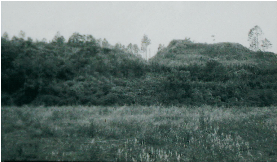
曾被日军挖掘的屯昌水晶矿遗址。