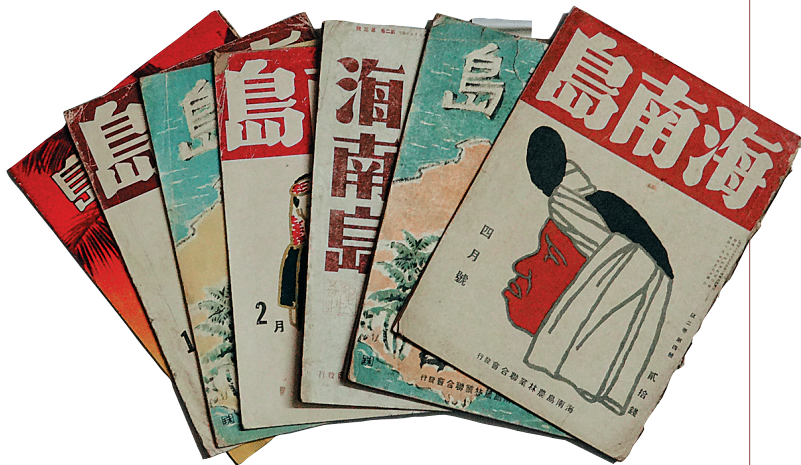
日方组织的海南岛农林委员会1941年发行日文版刊物《海南岛》。

在日军侵占海南期间,除了上述的矿业、农业外,日本企业还在林业、水产等方面专营的企业,从事掠夺式的“开发”,其目的也是为了直接地支持日本的侵略战争。在此时期,海南的主要经济活动,包括工业、农业、手工业以及贸易的活动,都在日本占领军的控制之下,海南岛经济实际上已经被日本纳入了其战时统制经济的框架之中,从而彻底中断了自清末以来,海南岛经济自主发展的进程,这对于海南的历史发展也有重大的影响。■